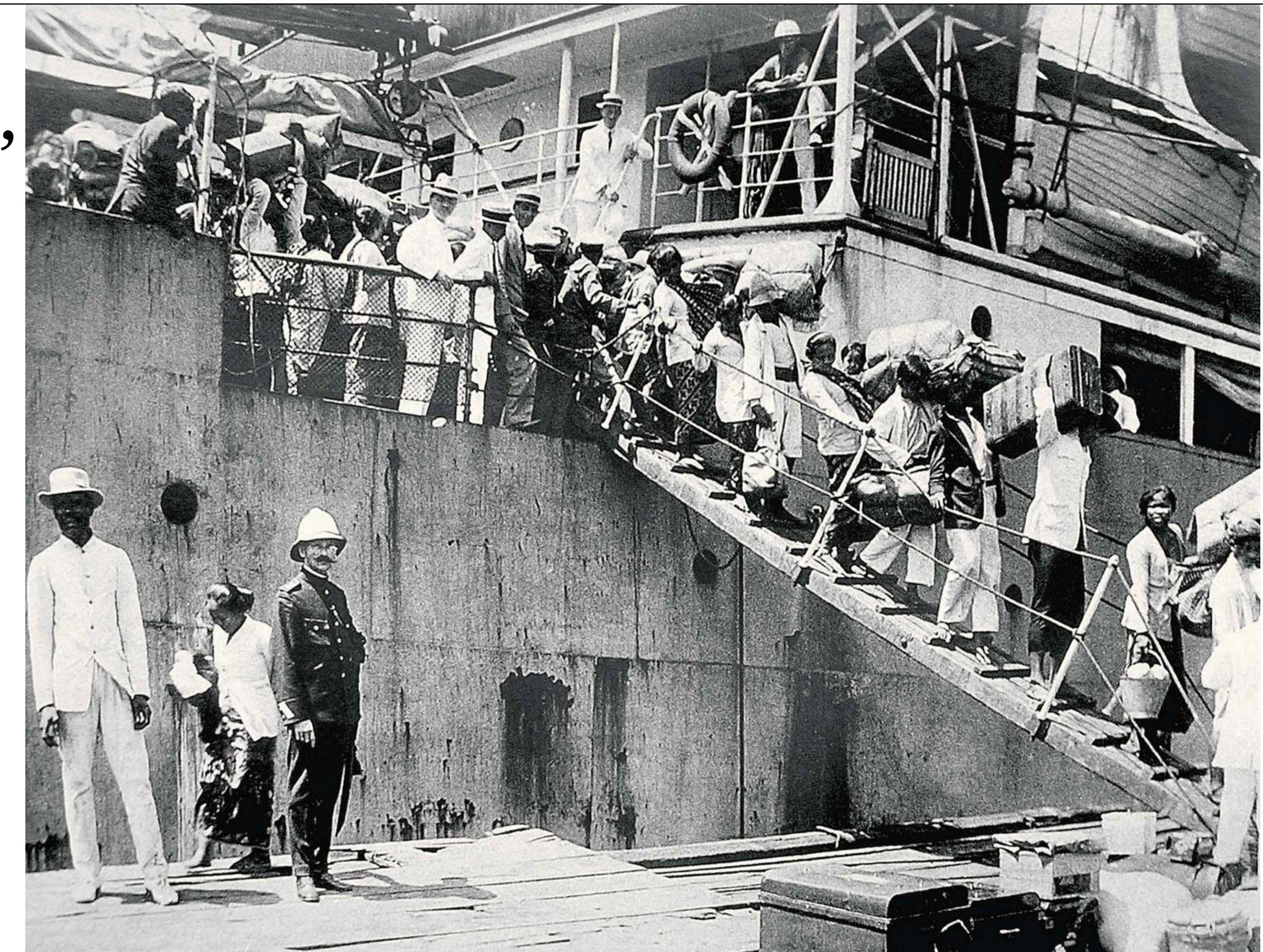
Javaanse contractarbeiders komen aan in Paramaribo (1923).